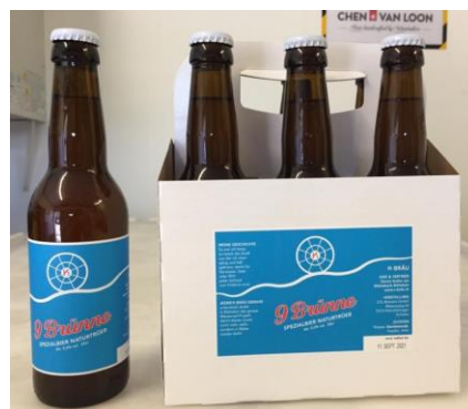
Die Flasche und das 6er Pack «9Brünne»

serviert oder über d'Gass im Burestübli Böttstein erhältlich als 6er Pack oder im 24er Karton.