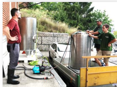
Umpumpen bei der CVL Brewery