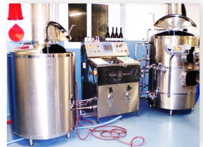
Hier wird s'9Brünne-Wasser zu Bier!

Jeder K- Bräu Genuss unterstützt den Verein direkt – Prost!