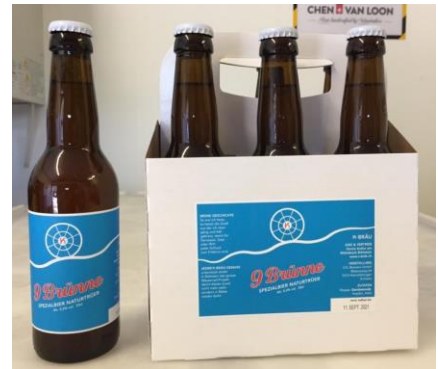
Die Flasche und das 6er Pack «9Brünne»

serviert oder über d'Gass im Burestübli Böttstein erhältlich als 6er Pack oder im 24er Karton.